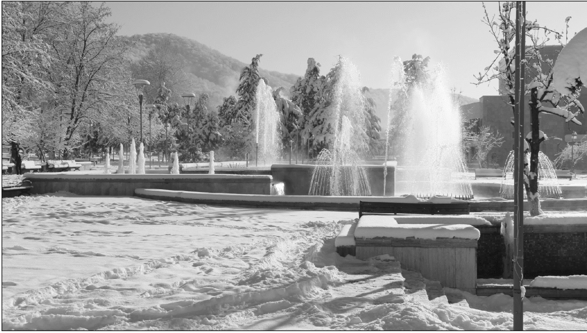
Qəbələnin qış mənzərəsi (8–11 yanvar 2015).